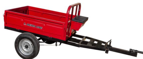
Remorcă 400 kg sau 500 kg